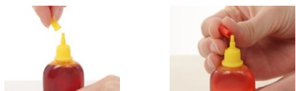
インクボトルのフタを取り外す キャップピンをグッと押し込む

まずはインクボトルのフタを取り外します。付属のキャップピン(針付き)をインクボトルの先端に取り付けたら、垂直にゆっくりと差し込んで開栓します。ボトルを強く握ると、インクが飛び出る恐れがあります。※詰め替え後はインクボトルの先端にフタを付けて保管します